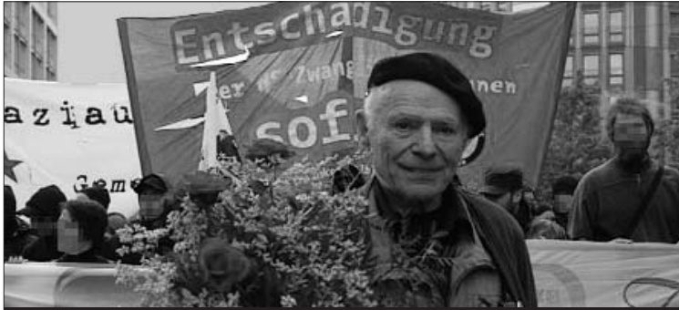
Peter Gingold bei der Bündnisdemonstration am 8. Mai 2005 zum 60. Jahrestag der Befreiung in Berlin-Mitte

Die antifaschistische Bewegung trauert um Peter Gingold. Am 28. Oktober 2006 verstarb er im Alter von 90 Jahren in Frankfurt/Main. Gingold war Kommunist und Widerstandskämpfer gegen die NS-Barbarei