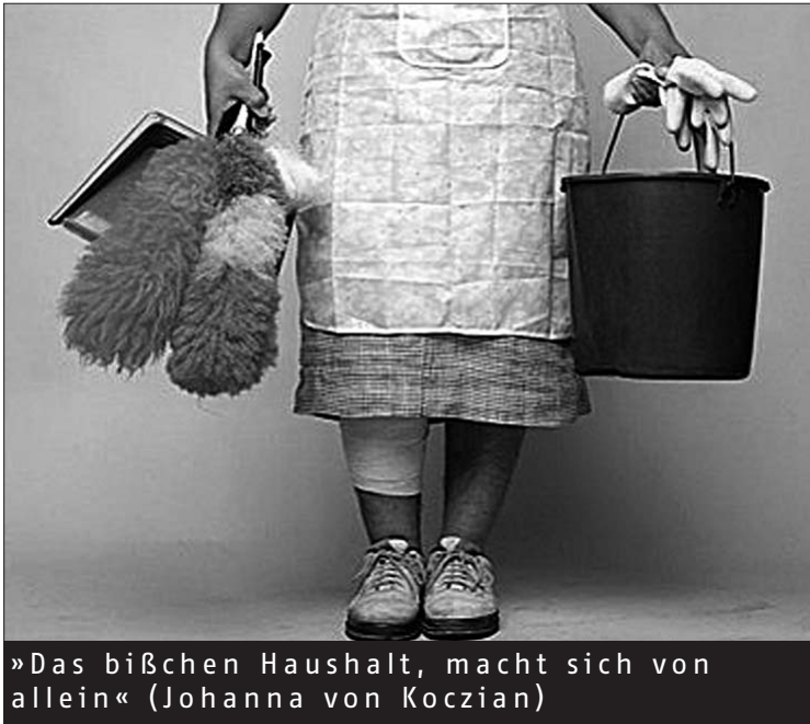
»Das bißchen Haushalt, macht sich von allein« (Johanna von Koczian)

Lohn und die Arbeitsbedingungen können von den Arbeitgebern bis auf ein kaum noch zu vertragenes Niveau verschlechtert werden. Selbst Lohnbetrug ist keine Ausnahme.