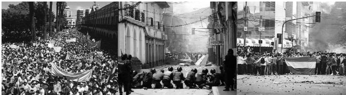
Massendemonstration und Proteste mit Militäreinsatz in Cochamba

Cochabamba, die drittgrößte Stadt Boliviens, hat es vorgemacht. Im Jahre 2000 gelang es die ein Jahr zuvor vom Internationalen Währungsfond (IWF) erzwungene Privatisierung der öffentlichen Wasserversorgung zurück zunehmen