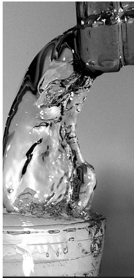
Glasklar? Das war einmal!