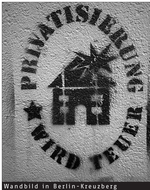
Wandbild in Berlin-Kreuzberg

Drittens: Keinesfalls darf unerwähnt bleiben, dass Privatisierung öffentlicher Bereiche – jedenfalls nach der vorherrschenden Praxis – mit extremer Geheimhaltung verbunden ist. Sowohl demokratische Mitsprache beim Zustandekommen, als auch demokratische Kontrolle blieb und bleibt versagt.